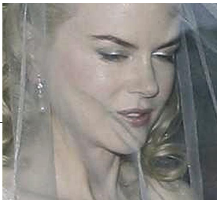
Nicole Kidman el día de su boda con Keith Urban

Jamás las mujeres musulmanas han ido tan tapadas como en nuestros días. Es un error hablar de hábitos feudales. El burka no llegó a Afganistán hasta principios del siglo XX, cuando el rey Habibulá lo impuso a las mujeres de su harén, para impedir que su belleza tentara a los hombres. El burka, como antes el velo, fue una moda aristocrática. Y sólo en nuestros días, tras décadas de infructuosas campañas de occidentalización y laicismo, se ha convertido en símbolo de un islamismo radical extendido en gran parte de la sociedad.