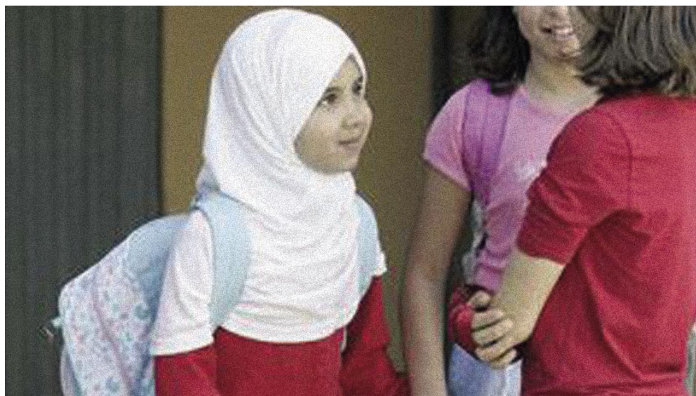
Una niña acude a clase con en Gerona