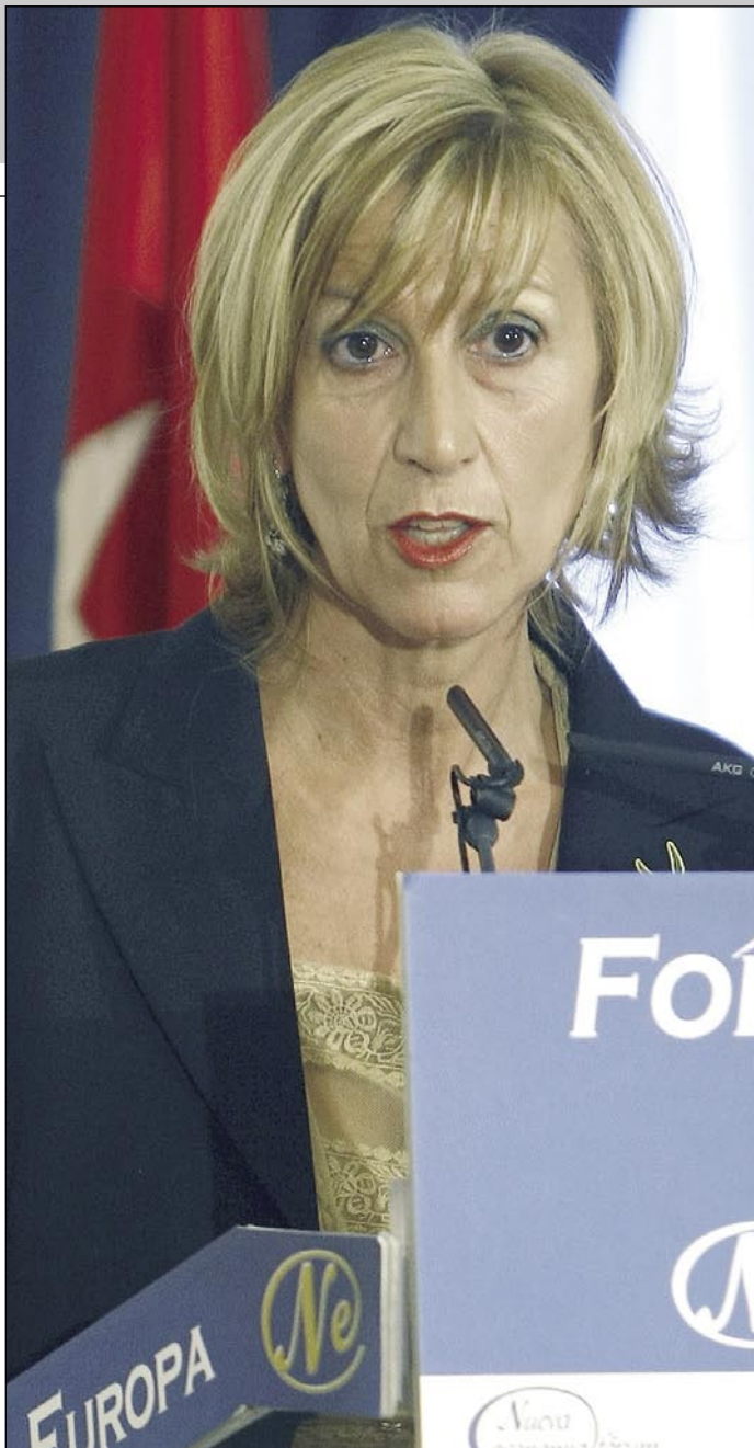
Rosa Díez durante una sesión en el Forum Europa

Una iniciativa puesta en práctica por el propio Ejecutivo y que ahora se extenderá también a los funcionarios que trabajen en la Administración regional. La medida plasma en la práctica la ley de normalización lingüística.