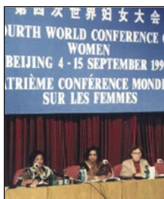
Rueda de prensa en la IV Conferencia de Naciones Unidas sobre la Mujer en 1995

El Tribunal Superior de Justicia de Andalucía ha expresado en su fallo la ausencia de inocuidad de determinadas expresiones, por ejemplo, la palabra “género”. La IV Conferencia Mundial de Naciones Unidas sobre la Mujer, Pekín 1995, fue el despegue de la “perspectiva de género”. La directiva de la conferencia de la ONU