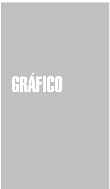
Si Am zzriusting el dolorem at. Uptat, volobor sum velit la feummy