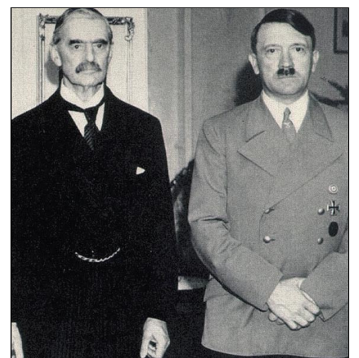
Chamberlain y Hitler en septiembre de 1939

expansionista de Hitler. En casos tan palmarios, se hace imprescindible la urgencia. Para acabar con ANV no cabe redefinir lo que es una moción. De ahí un aplauso merecido a Rosa Díez: por su velocidad a la hora de responder con sensatez y por sus reflejos ante la manipulación de un principio democrático.