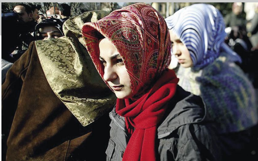
Jóvenes musulmanas tocadas con el hijab

EL VELO MUSULMÁN Las esposas de Mahoma no usa-