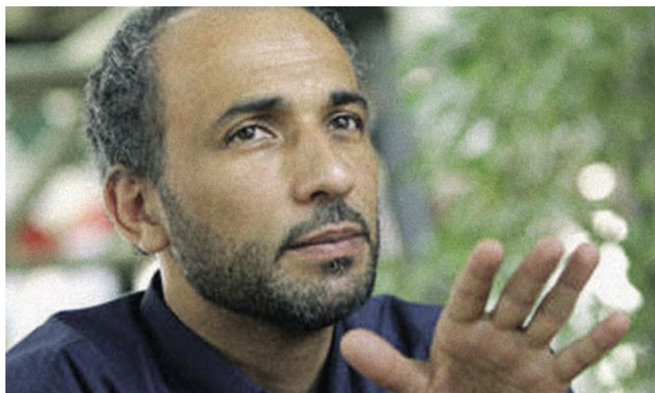
Tariq Ramadan

"Señor Ramadan, déjese de monsergas y ayude al llamado "pueblo de las mezquitas", que está muy interesado en librarse de la ideología que le ha llevado a teorizar que los musulmanes serían una especie de etnia autó-