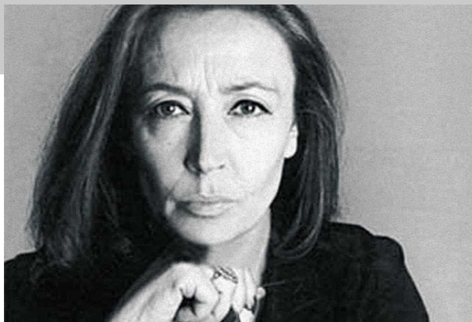
Oriana Fallaci / AGENCIAS

Magdi Allam crítica las actitudes más radicales en relación al Islam